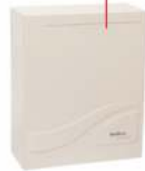
Central Digital de Interfones Intelbras LOBBY 640 i