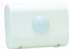
Sensor de Presença Modelo MI-600

Em todo o condomínio estão instalados 96 sensores de presença modelo: MI-600 da TEKTRON ( www.sensortektron.com.br ). No surgimento de qualquer irregularidade, entrar em contato com Sr. Edson através do telefone (11) 2742-1347.