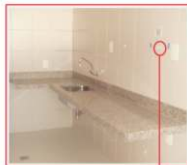
PAREDE SOBRE BANCADA DA COZINHA PONTO DE ABASTECIMENTO ÁGUA MINERAL (APARTAMENTO PADRÃO)

A Naturágua desenvolveu caminhões-tanques especiais em aço-inox que levam a água da fonte até os reservatórios instalados na cobertura do seu edifício. Esses reservatórios são monitorados 24 horas por dia por sensores digitais que controlam a sua capacidade. As tubulações são 100% atóxicas e se unem por Thermofusão, um processo de instalação de tecnologia avançada através do calor. A Thermofusão elimina os riscos de vazamentos e garantem maior grau de segurança na condução da água mineral até a sua família.