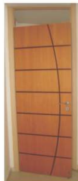
Porta Principal da Pormade Linha FRIZZATA ref. FRI 003