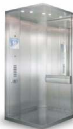
Cabine modelo NEO LIFT