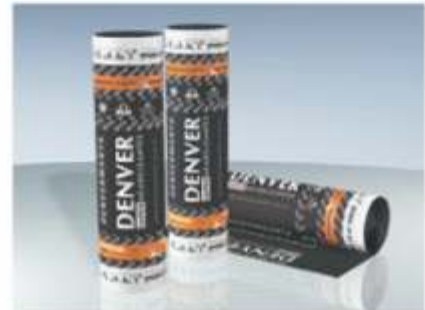
Mantas Asfálticas - DENVER

Já nas áreas do Pilotis e Cobertura receberam o sistema de MANTAS ASFÁLTICAS, referência PP 4 mm, também de fabricação DENVER.