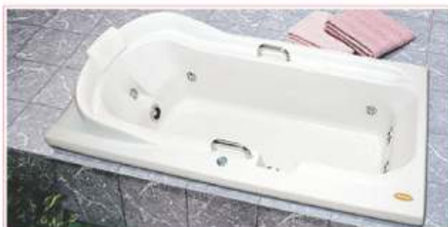
Banheira JACUZZI - Modelo REGINA 4

As Banheiras são da marca JACUZZI ( www.jacuzzi.com.br ), modelo REGINA 4, dimensões 1,50 x 0,90 x 0,45 m (Cód. RG15090G4) com 08 dispositivos de hidromassagem e vazão da bomba de 15m 3 /h.